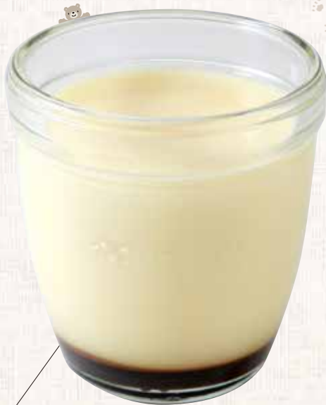
カスタードプリン 324円

プリンといえばモロゾフのカスタードプリン。それくらい、神戸っ子の定番おやつとして浸透しているカスタードプリンの原材料はとてもシンプル。余計な物は加えず、卵、牛乳、砂糖、バニラ香料だけで蒸し焼きにする秘伝のレシピは、誕生当時から現在に至るまで50年以上ほぼ変わらない。なめらかで、やわらかなプリンと、ほのかにビターなカラメルソースは絶妙なコンビネーション。併設のカフェでは、アイスクリームまたは生クリーム、季節のフルーツを添えた特別なプリンを楽しめる。