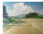
▲甲子園口 1940年頃