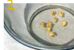
ザルに並べて約1~2日カラカラになるまで天日干しにする