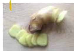
皮がついた根ショウガを洗って3mm程にスライス