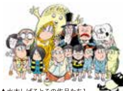
▲水木しげるとその作品たち1 2010年頃

【住所】神戸市中央区明石町40 【時間】10:00～20:00(最終日は17:00まで) ※入場は閉場30分前まで 【休】開催期間中は無休 【料金】一般 1,000円、中高大生 800円、小学生 300円、小学生未満無料 【TEL】078-331-8121