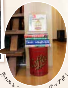
思わぬところにコーヒーマシンが！