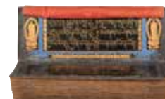
▲《八千頌般若波羅密多教》 13世紀 金書 ブータン王国国立図書館

【住所】神戸市中央区脇浜海岸通1-1-1 【時間】10:00～17:00 【休】月曜(祝日の場合は翌平日) 【料金】一般1,400円、大学生1,000円、70歳以上700円、高校生以下無料 【TEL】050-5542-8600(ハローダイヤル)