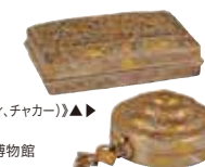
《キンマ容器(ティミイ、チャカー)》▲▲ 20世紀 銀に鍍金 ブータン王国国立博物館