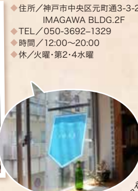
昼は陽差しが、夜は夜風が気持ち良い窓辺でビールやコーヒーを楽しめる

神戸の本屋さん、と聞くとどんなイメージをしますか？老舗の専門書店、うずたかく文庫本が積み上げられた古書店、セレクトが洒落た雑貨店のような洋書店：今号で紹介する本屋さん、個性的なお店のカラーを深く深く掘り下げていく古本屋さん。お店に並ぶのは古本だけでなく、選り抜かれた新刊、雑貨やコーヒーマシン、お酒まで！予測不可能なレジャーハントに出掛けよう！