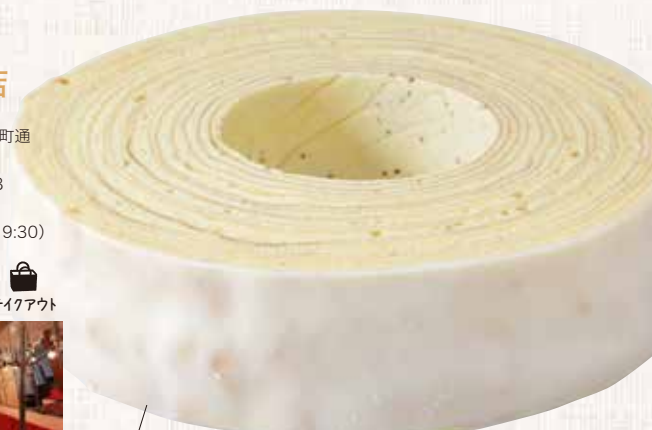
バウムクーヘンリング ® 15 1,620円

自然の素材の風味を大切に100年以上も引き継がれてきたバウムクーヘン。ドイツ出身の創始者カール・ユーハイムは、第一次世界大戦中に捕虜として中国・青島から日本へ連行され、1919年、日本で初めてのバウムクーヘンを焼くこととなった。戦争、収容生活、震災などの苦難を経て妻エリゼとともに神戸にユーハイムを開店したのが1923年。以来、ユーハイム夫妻のこだわり「体のためになるから美味しい」を軸に、自然のものを自然のまま使ったレシピは、しっとり食感と国産バターの厚みある風味で親しまれている。